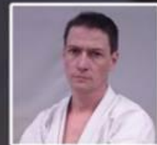
O BRIGNON 4 ème DAN KARATE

OUVERT À TOUS LES PROFS, ASSISTANTS ET GRADÉS